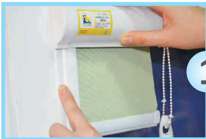
Рисунок 1 - Замір системи Мінікасета М19